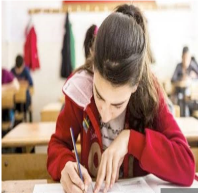
Viranşehir Rehberlik ve Araştırma Merkezi

Zaman Yönetimi İçin Kullanılan Teknikler